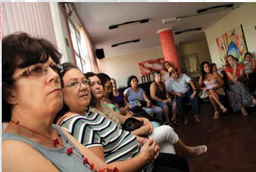
Cerca de 30 pessoas participaram do evento que retomou as atividades do programa

Ao término do filme, um debate sobre as batalhas de gênero se es-