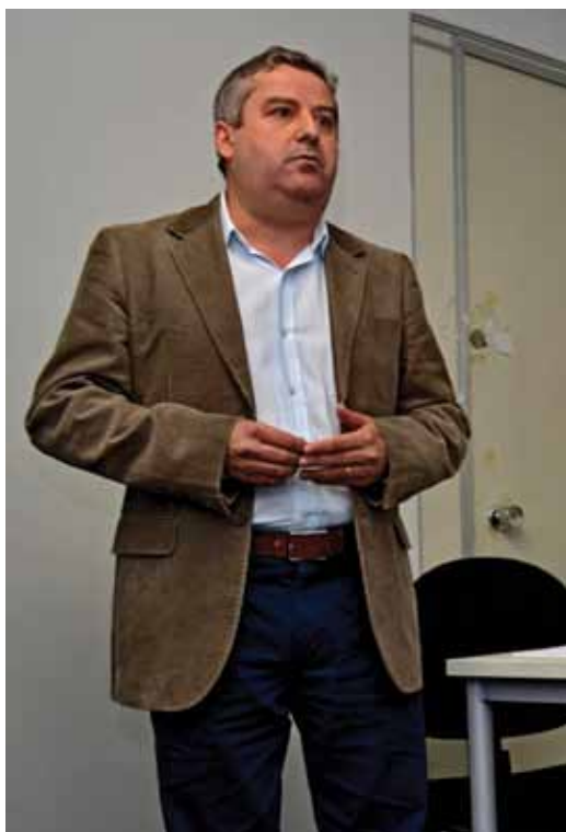
Segundo Camilo Fernandes, mudanças poderiam ser adiadas

Os números do Plano II foram apresentados aos colegiados do Fundo de Pensão - Comitê Gestor e conselhos Fiscal e Deliberativo -, em reuniões ocorridas nas últimas semanas, pelo atuário e representantes do Banesprev, gerando protestos e críticas à gestão por parte dos eleitos