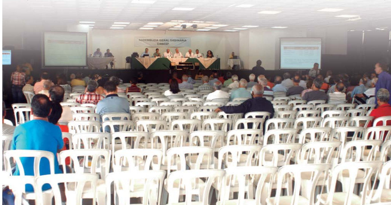
Condução antidemocrática das assembleias da Cabesp promove esvaziamento e impede o debate de ideias

Comissão Nacional dos Aposentados do Banespa