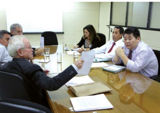
CNAB protocolou pedido de esclarecimentos sobre Mutuoprev na Previc