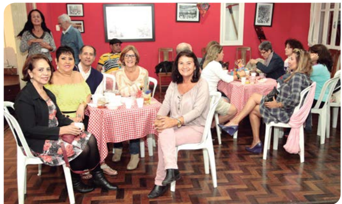
Associados do Rio de Janeiro em clima de confraternização junina