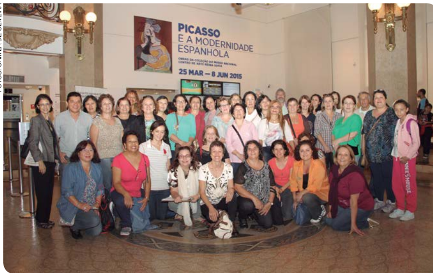
Obras de Picasso e outros artistas espanhóis foram apreciadas pelos participantes do programa

do por momentos de surrealismo e expressionismo.