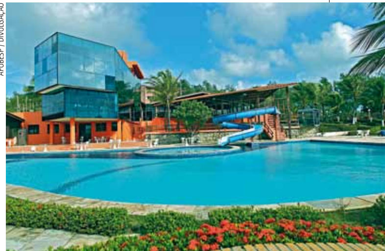
Porto D'Aldeia, em Fortaleza, é um dos resorts conveniados

Os associados e seus dependentes contam também com a facilidade de comprar ingressos a preços mais baixos para diversos parques de diversão. Se a ideia for fazer um passeio cultural com a criançada, a boa pedida é visitar o Aquário de São Paulo, que conta com espécies raras de peixes e répteis, Museu de Fósseis, Planetário, Vale dos Dinossauros e Cine 3D.