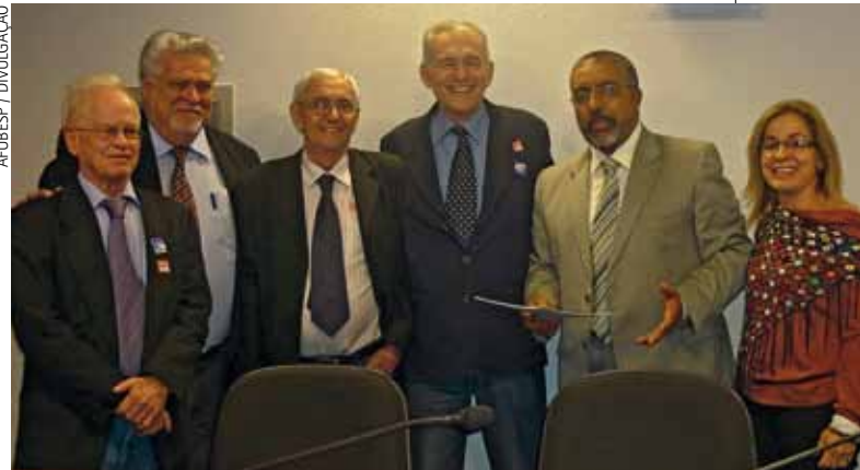
Senador Paulo Paim (PT-RS) foi um dos parlamentares visitados pela CNAB

"Foi preciso aguardar o término do recesso parlamentar, que só acabou efetivamente após o feriado de carnaval, para retornar a Brasília em busca de reforçar os apoios à nossa luta", conta o coordenador da CNAB, Her-