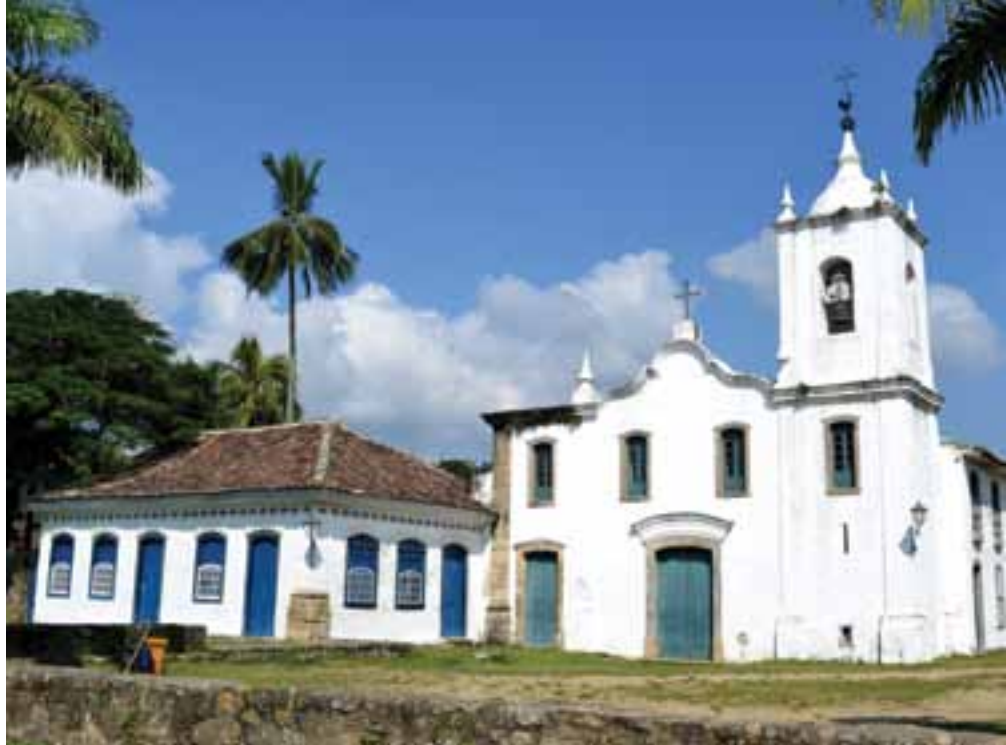
Casario colonial é apenas uma das atrações da cidade histórica

Aproveite tudo o que a cidade oferece hospedando-se na Pousada Villa Harmonia, conveniada à Afubesp