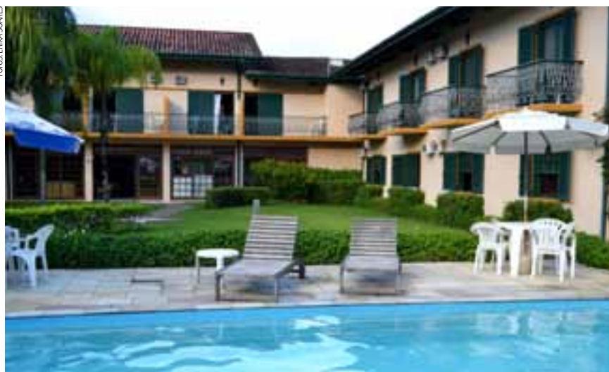
Hotel conveniada à Afubesp facilita o pagamento das diárias e serviços

Conveniada à Afubesp, os associados da entidade e seus dependentes podem usufruir de tudo isso com forma de pagamento facilitado.