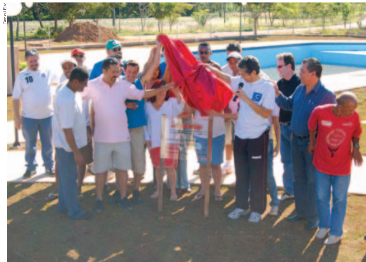
Entrega das piscinas encerra série de investimentos realizados pela diretoria a pedido dos filiados

Recentemente, a Afubesp realizou duas atividades que levaram lazer e diversão a seus associados. A inauguração do parque aquático da Colônia de Férias e Camping de Barbosa, ocorrida em 26 de maio, é uma