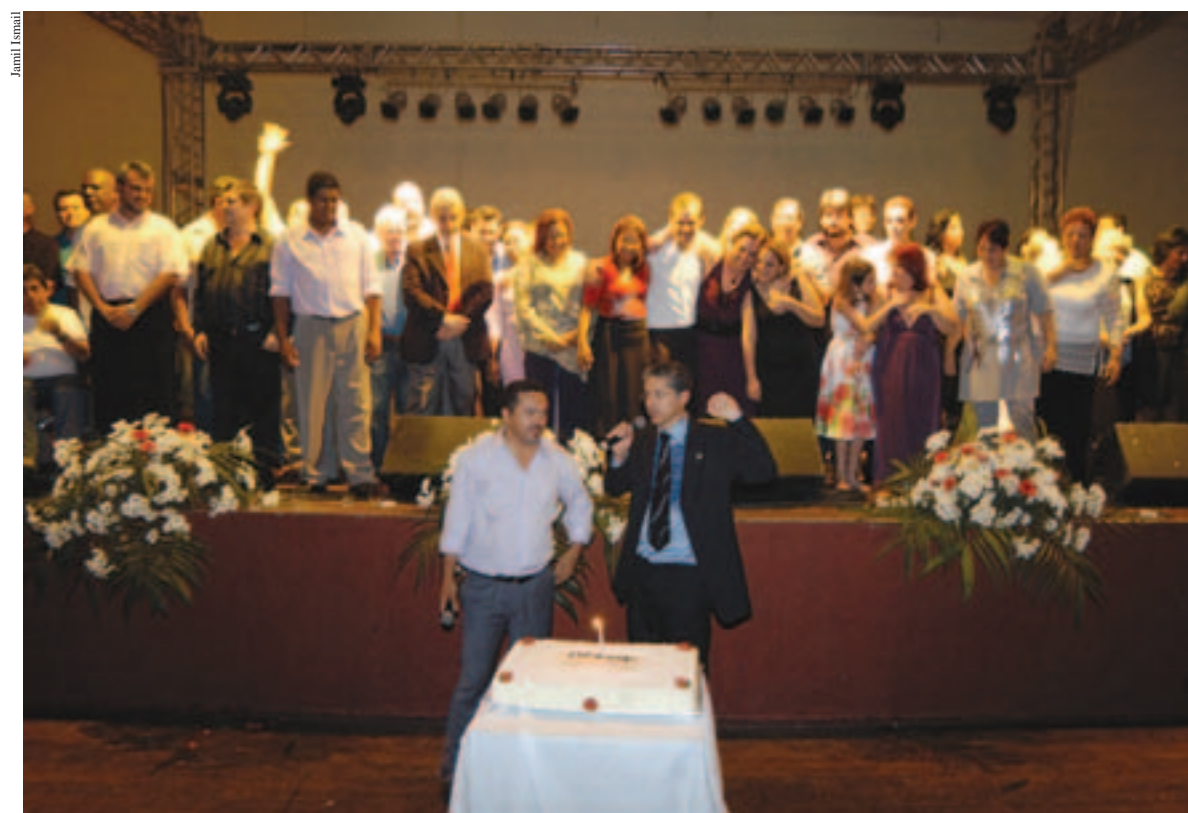
Associados, dirigentes sindicais e parceiros da Afubesp participaram da festa realizada em 1º de junho