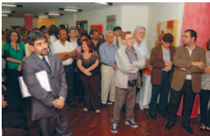
Dezenas de dirigentes sindicais e de entidades prestigiaram evento