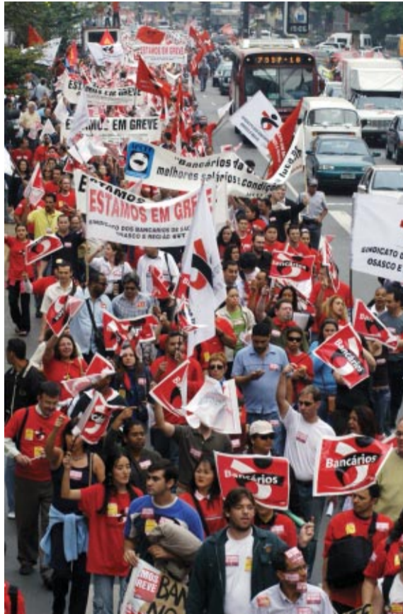
Na sexta, 17, cerca de quatro mil bancários participaram de passeata na Av. Paulista (SP)

Ainda existem diversas bases sindicais que devem engrossar o movimento a partir desta segunda ou terça-feira, caso os banqueiros não apresentem nova proposta.