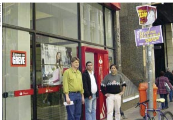
Agências de Porto Alegre (RS) também foram paralisadas na semana passada