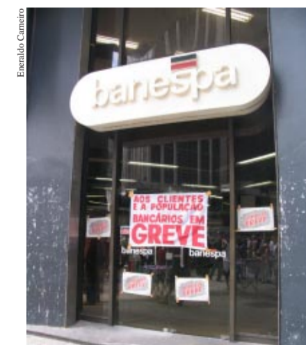
Rio de Janeiro: Banespa...