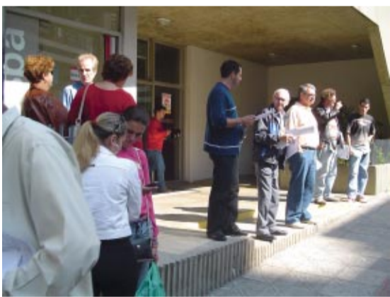
Em Florianópolis, unidades do Banespa...