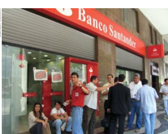
... e Santander permaneceram fechados