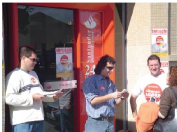
... e do Santander não abriram as portas