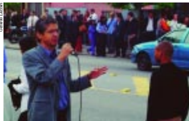
Centro administrativo ficou parado até às 10h

Na quinta-feira, 18, o Centro Administrativo do Santander (Casa), em Santo Amaro, ficou totalmente paralisado até às 10 horas, como resultado de mais um ato de protesto contra as dispensas ocorridas no banco. A