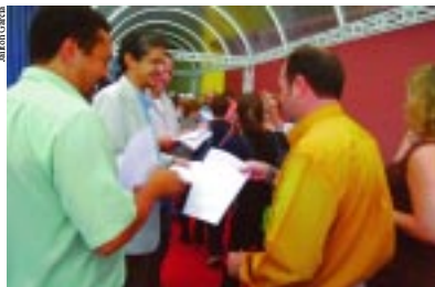
Gerentes do grupo foram recepcionados por representantes dos funcionários, em São Paulo

Dois dias depois (12), a atividade contra as demissões discriminatórias ocorreu em frente ao Pavilhão Amarelo, do Expo-center (próximo do Shopping Center Norte), em São Paulo, onde diretores do Sindicato dos Bancários de São Paulo e da Afubesp foram recepcionar cerca de quatro mil gerentes do grupo que iriam participar de um evento marcado pelo banco. Além de dialogar com os colegas, os manifestantes distribuíram manifesto, no qual pediam apoio para