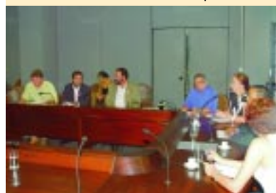
Bancários exigiram contrapartida do banco