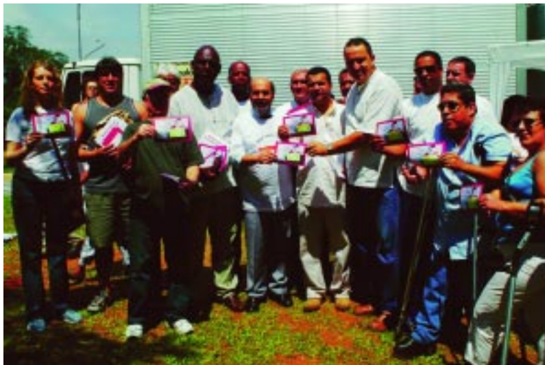
Dirigentes sindicais e da Afubesp denunciaram o Santander Banespa ao ministro José Graziano