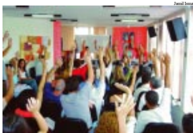
Assembleia referendou conjunto de modificações

O texto do edital, publicado na edição nº 678 do Jornal da Afubesp e disponibilizado no site da entidade (no dia 3/12), serviu de guia para os debates. "Fizemos um proces-